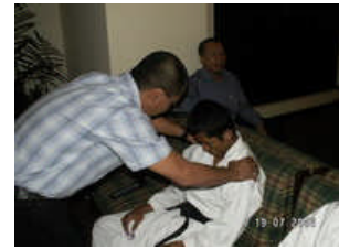
Stage Hypnosis Show: Corporate Gathering