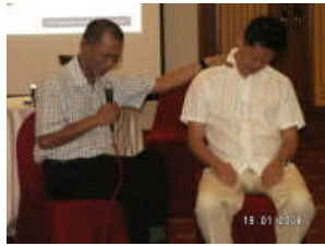
Public Workshop: Hypnotherapy